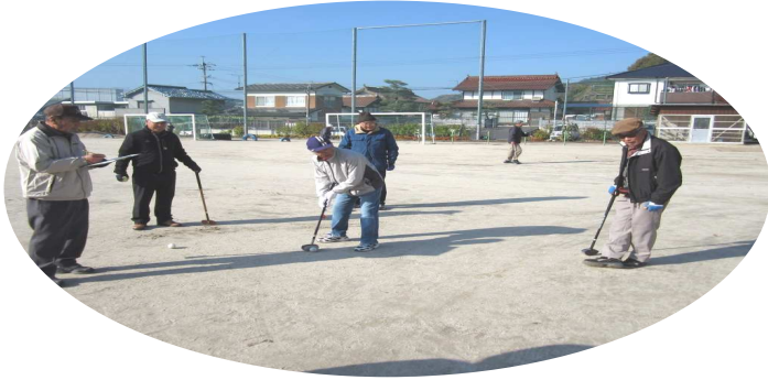
裏面にプレーの様子を掲載しています。