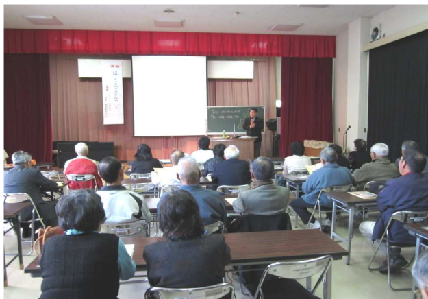
63名の皆さんが熱心に学ばれました。