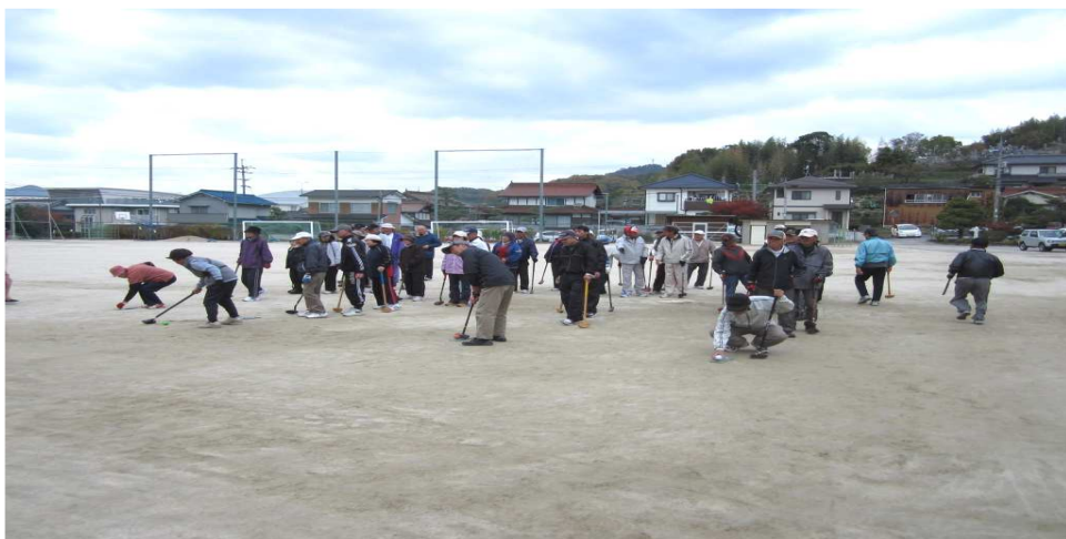
ホールインワンゲーム