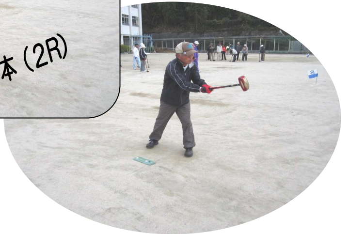
ホールインワンを狙っての一打