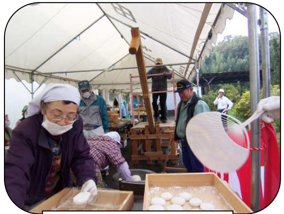
足踏み式餅つき機実演