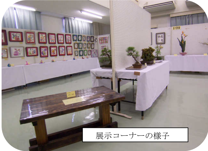
展示コーナーの様子