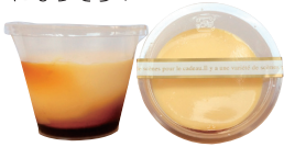
ゆう食品プリン (2個入り / 500円)