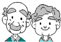
避難行動要支援者

また、この個別計画を使って防災訓練を実施することなども有効な手段として考えられます。避難支援の流れを簡単に示すと次のようになります。