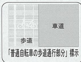
「普通自転車の歩道通行部分」標示