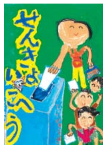
▲昨年度の入賞作品

対象 小・中学生、高校生 画材・サイズ 画材は自由、画 用紙の4つ切判、8つ切判