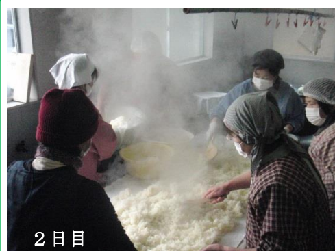
2日目 米を蒸し、菌をつけて器械に入れる。