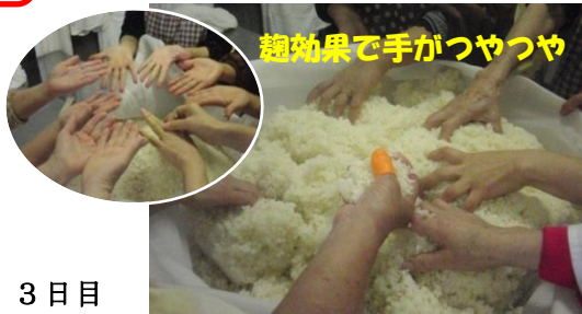
3日目 器械から出して混ぜる。(麴) 大豆、ハトムギを洗い水につける。