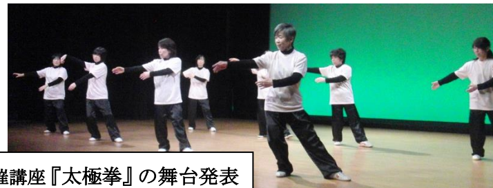
大草公民館主催講座『太極拳』の舞台発表