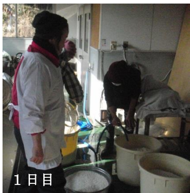
1日目 米を洗い、水につける。