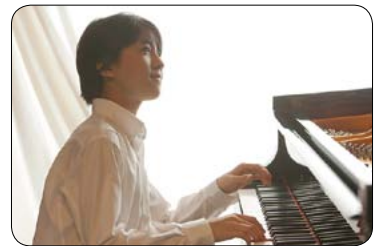
▲牛田智大 衣装提供:株式会社オンワード樞山

販売場所 ポポロ、ポポロオンライン、うきしろロビー、フジグラン三原、ワタナベ楽器 ほか