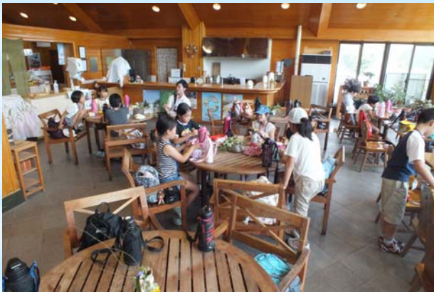
お昼は班ごとに食べました。 みんなおいしそうに食べていました。