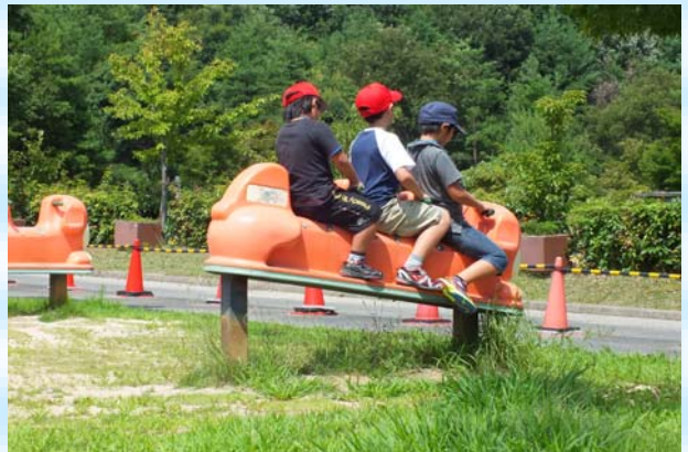
みんなで仲良く、ぎっこん、ぼったん ♪