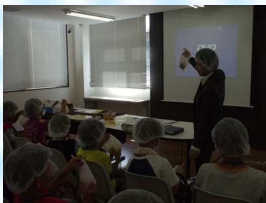
パンの製造は、袋詰めまで手作りにこだわっています。 手作りが一番のレシピなのかもしれません。