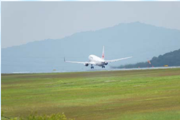
「車輪が収まる場所が見えた」という児童 がいました。