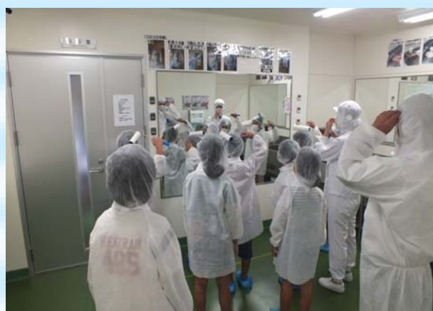
工場内は衛生面がとても重要です。 レシピは企業秘密のため、撮影もここまでです。