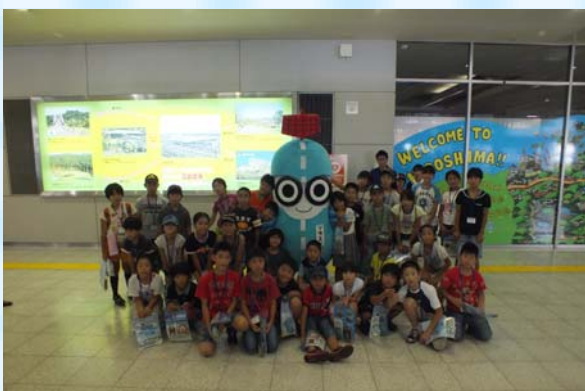
ソラミィとパシャリ！！