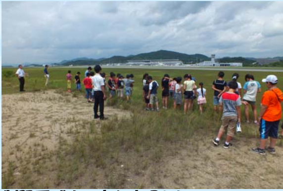
制限区域内の高台広場から 飛行機の離発着を見学します。