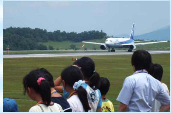
飛行機が飛び立ちます。