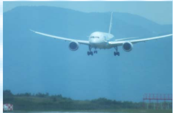
着陸の瞬間を見ました。 大迫力です。