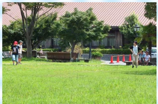
食後の運動、夏休みパワー全開です！！