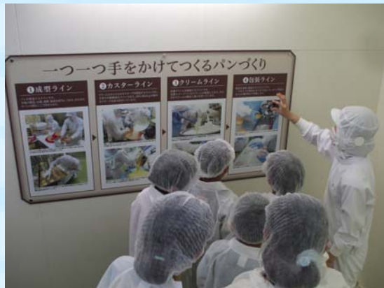
子ども達もパネルを真剣に見ています。