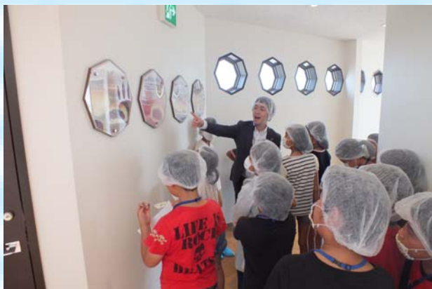
人気のクリーむパンについて勉強しました。