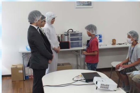
社員の方の笑顔がとても印象的でした。 丁寧なご対応ありがとうございました。