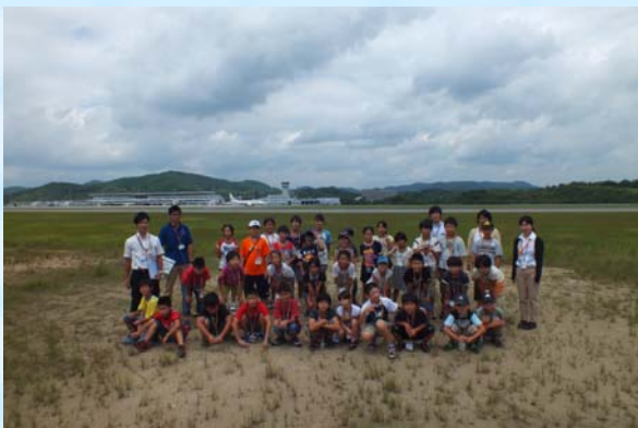
高台広場でパシャリ！！