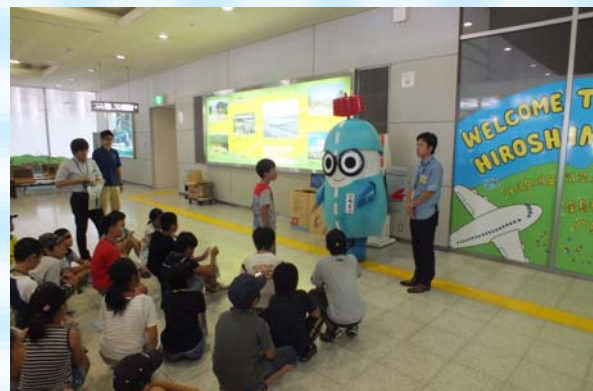
ありがとうございました！！