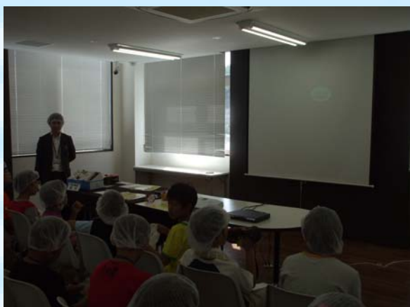
東京進出の際のエピソードも 教えていただきました。