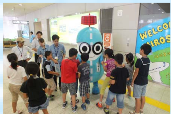
マスコットキャラクター「ソラミィ」が 会いにきてくれました。