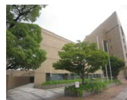
広島県情報プラザ

掲載情報は、適宜更新されます。是非ご活用ください。詳細は、担当課・団体等に直接お問い合わせください。