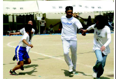
親子リレーでのデッドヒート。 (深連合町内会 5月25日)