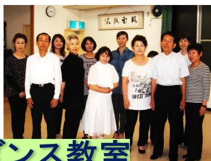
宮浦社交ダンス教室