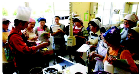
講師の説明と手さばきにくい入ります。(イタリアン)