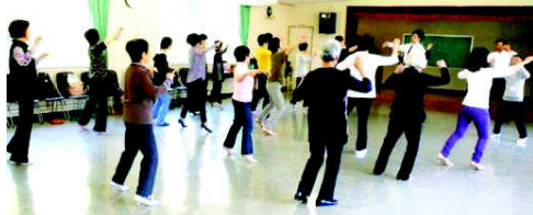
初めての方を交えて、ステップの練習から始めました。(社交ダンス)

各講座とも定員を大幅に上回る応募があり、初日に集まれた皆さんは「期待と不安でドキドキよ〜!」とおっしゃられながら、講師の丁寧な指導と顔見知り同士で励ましあい(?)ながら和気あいのスタートです。