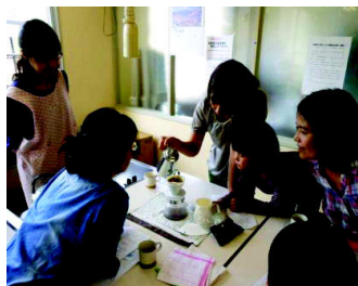
ドキドキしながら淹れてみました。