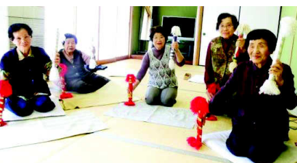
「身体全体で調子を取るの、体が温まるわよ〜。握力も落ちないし、なによりボケ防止に最適!」と会員の皆さん。 毎月1・3(木)の午前中に開催中。見学も大歓迎です。

安来節に合わせてシャンシャンと銭太鼓の軽妙な響きがコミセンから響いてきます。竹や紙筒の中に5円玉などを入れた太鼓を、節回しを取りながら叩いたり投げあげたりの手振り調子は野趣に満ちていて、見ていてもなかなか飽きが来ません。