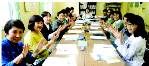
ゲーム仕立ての会話実習。「あらら、間違っただわ〜」「ノープロブレムよ〜」と、和気あいの講座風景。(英会話)