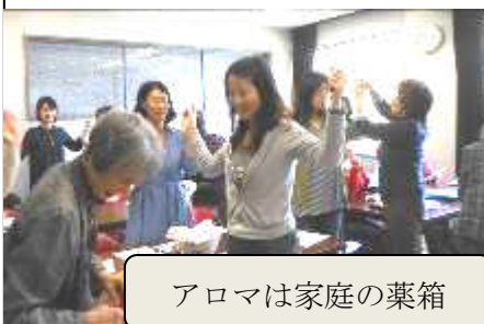
アロマは家庭の薬箱