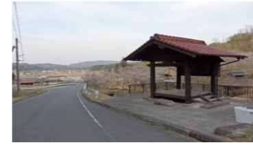
堂々原自然公園(上徳良)