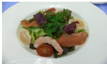
シーフードのサラダ仕立て

今後の体験講座では、「フランス料理」講座を予定しています。詳しくは決まり次第、「大和文化センターだより」でお知らせします。♡