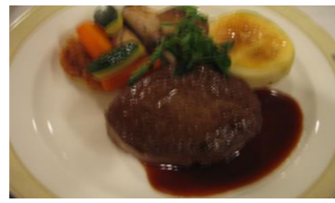
牛肉のステーキ温野菜添え