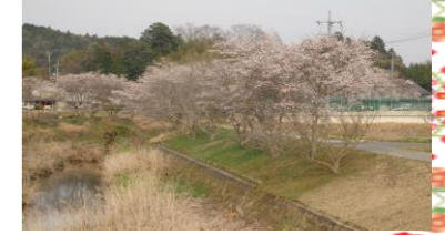
徳良川の桜(下徳良)