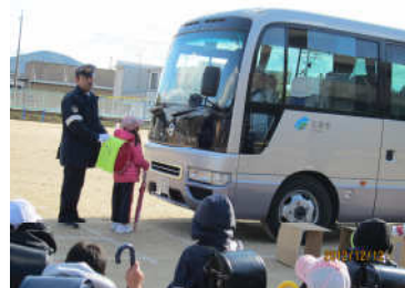
通学交通安全教室の様子