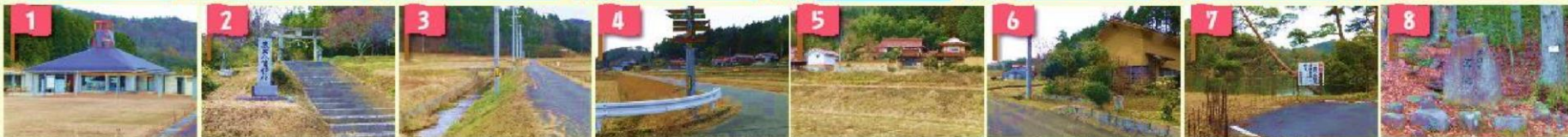
サイクリングターミナル 蔵宗八幡神社参道入口 室田烏井線中央 室田上線入口 土堀民家 土壁土蔵 助実池 芦田川源流