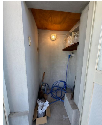
階段下収納（洗濯機設置スペース）