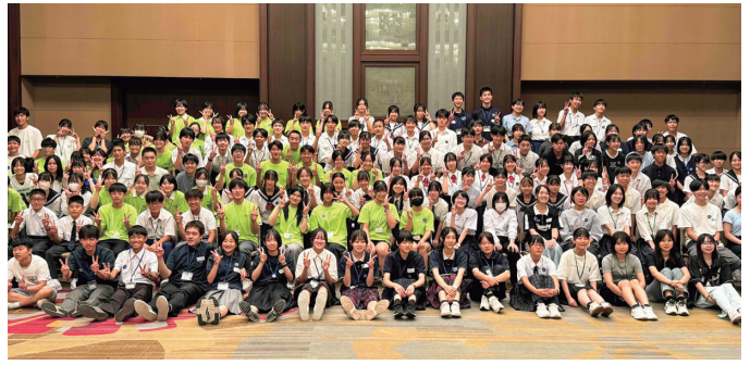
「全国平和学習の集い」の様子