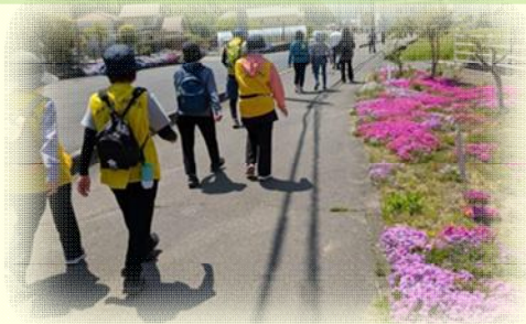
ウォーキングイベント