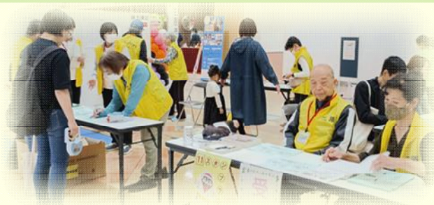
体力測定in三原市民保健・福祉まつり

運動イベントにあわせて、参加者に効果的なストレッチや筋力トレーニングを アドバイスし、自分たちの活動もPRしています！