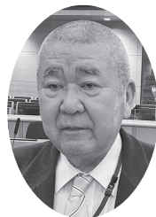
まさひろ ともはる 政平 智春