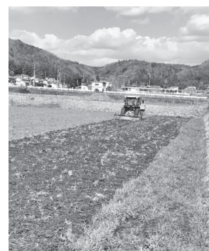
田植えにむけての耕運作業