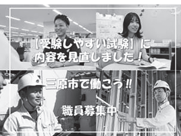
市職員募集ホームページ