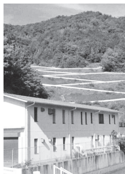
最終処分場(奥)や 浸出水処理施設(手前) の延命化も必要