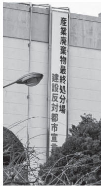
大型懸垂幕の設置を

答 懸垂幕の掲示は、必ずしも環境保全や不安払拭につながるものではないと考える。今後も水質検査や県への要望などの取組を継続していく。