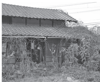
空き家の減少に向けた対策を