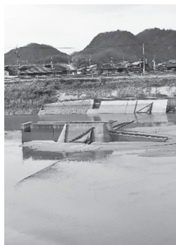
茶山崖頭首工 沼田東、長谷方面へ 取水・送水している