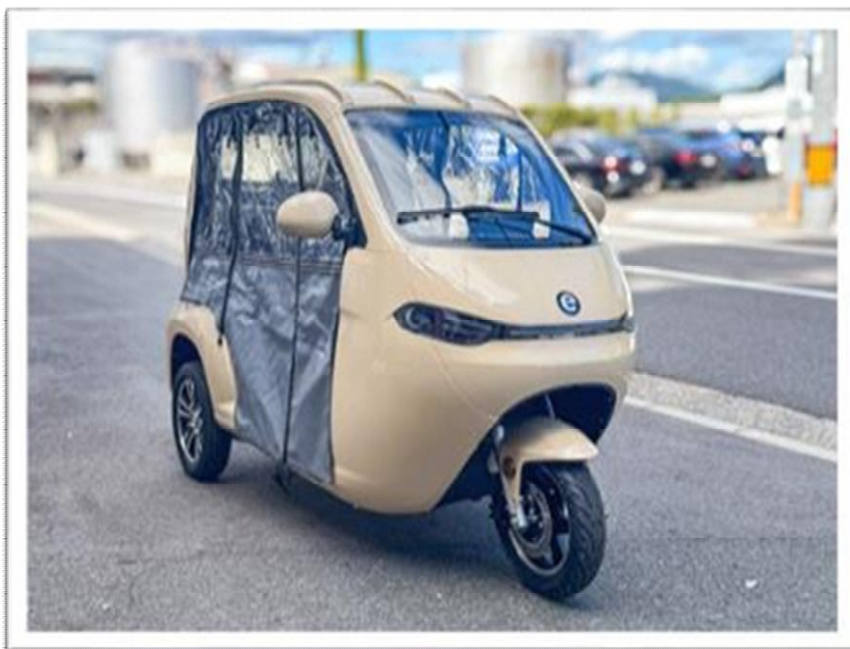
▲「電動三輪バイク(電動トゥクトゥク)」 普通免許で運転できる3人乗りの電動バイク “ペットとの乗車もOK”

新たな移動手段をレンタルで提供し、アウトドアパーク宇根山を中心に 周辺スポットへのアクセスが便利に！