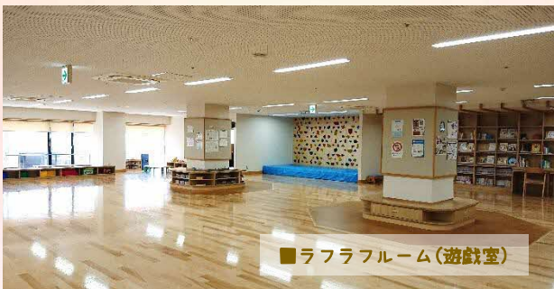
■ラフラフルーム(遊戯室)