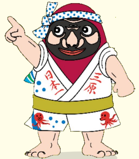
三原市公式マスコットキャラクター やさだるマン

空き家とは、年間を通して居住その他の使用がなされていないことが常態となっている建築物のことをいいます。