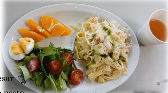
Salade Caesar Pate creme pesto