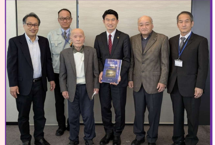
【出席者全員で記念撮影】