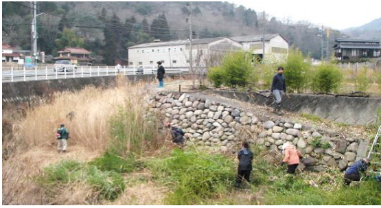
写真下右側2枚は中之町・和久原川)