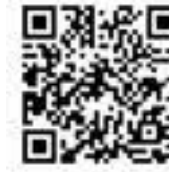
広島クリテリウム