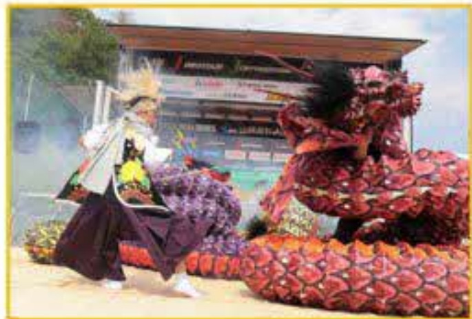
神楽 (大草神楽子ども研究クラブ・ 豊田流神楽団)