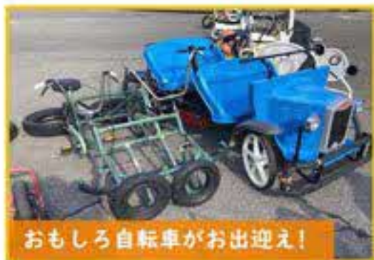
おもしろ自転車がお出迎え！