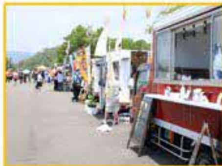
▲ その他にも多くのブースが出店