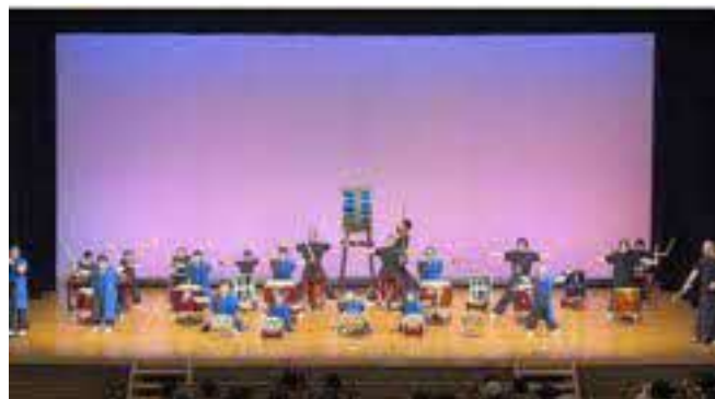
三原和太鼓教室～空組～