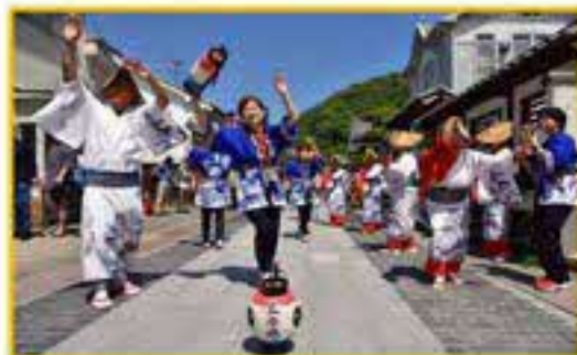
やっさ踊り (三原やっさ踊り 振興協議会)