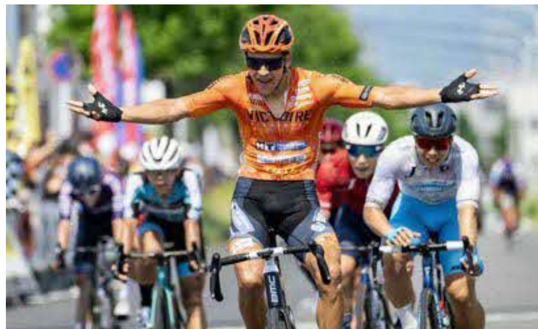
2024年広島クリテリウム