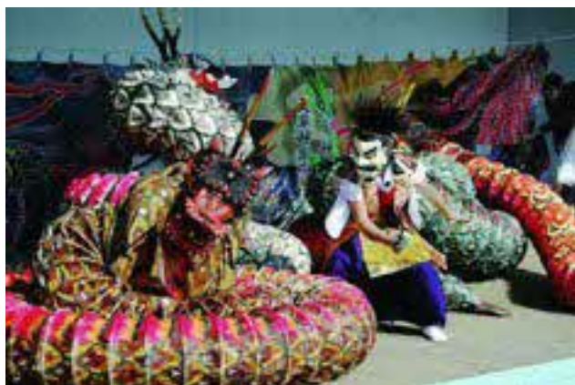
大草神楽子ども研究クラブ・豊田流神楽団