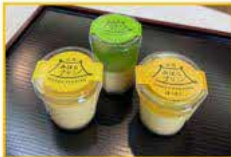
▲ 広島みはらプリン