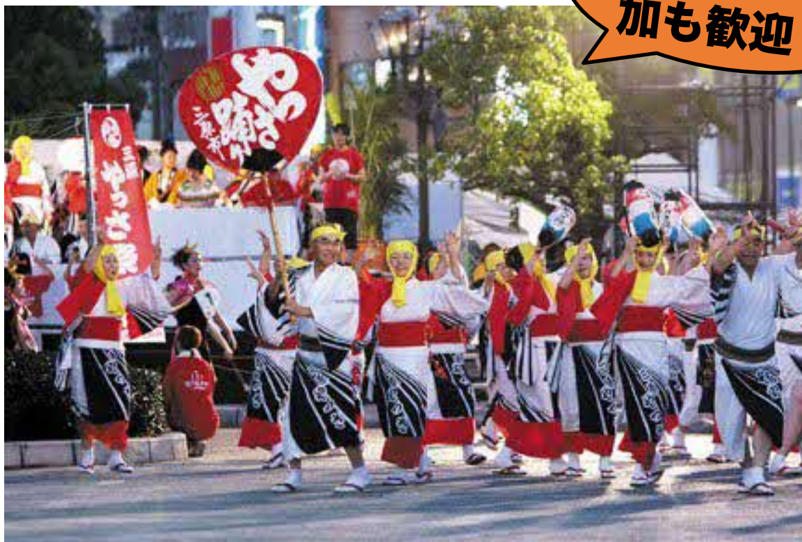
三原の夏の風物詩「やっさ踊り」