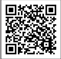
▲電子申請はこちらから

三原市選挙管理委員会に「不在者投票請求書兼宣誓書」を郵送または持参してください。