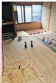
▲鴨居を撤去し、 光が入る明るい部屋に

広い物件ですが、少しずつ進んでいます。完成予定は令和8年の3月ごろ!進み具合は地域おこし協力隊のnoteをぜひ見てください。