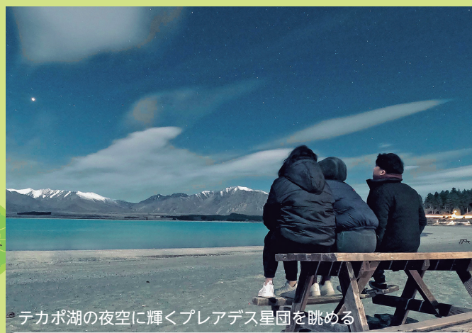
テカポ湖の夜空に輝くプレアデス星団を眺める