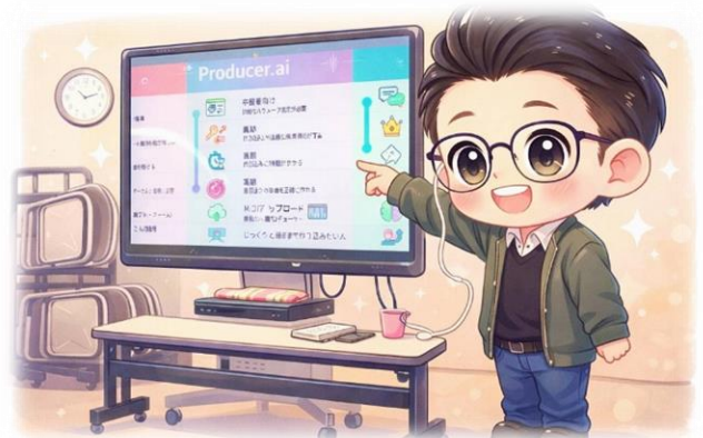
画像チャットGPTで作成した画像

とても楽しい講座で気づけばあっという間に時間が過ぎていました。新しい発見や学びが多く、さらに活用してみたいという気持ちが高まりました。どんなことができるのかこれから楽しみにしています。早速、チャットGPTを利用して、イラストを作ってみました。