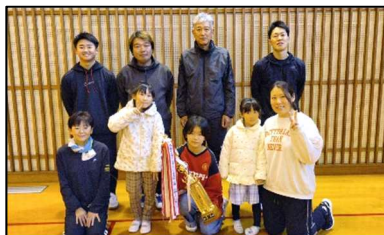
全勝優勝の第2支部

今大会は中高生の参加も多く、37名の方が参加されました。試合は4つの支部に分かれて対戦し、白熱した試合が続きました。優勝は第2支部でした。13年ぶりの勝利ということもあり、メンバーの皆さんは大変喜ばれていました。おめでとうございます。