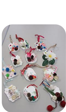
個性豊かな部屋飾りが出来ました