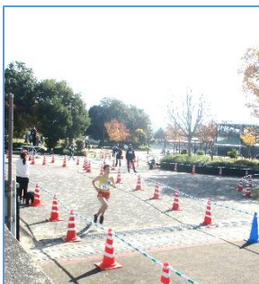
11月16日(日)中国中学校駅伝大会

駅伝部は、陸上部だけではなく、他の部活動からも募集して練習に取り組みました。仲間とともに目標に向かって励まし合いながら努力してきた成果を出すことができました。