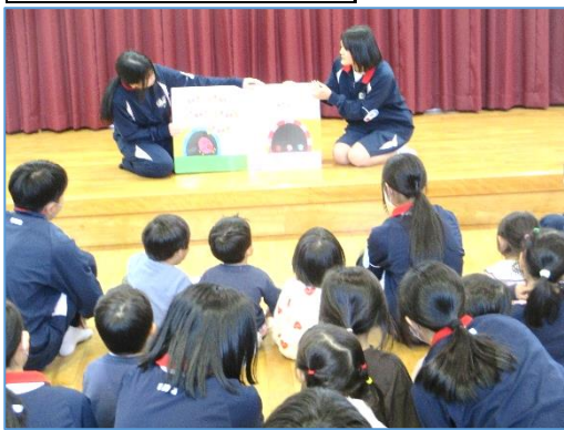
11月4日(火)3年生保育実習

家庭科で学んだ知識を実際の保育現場で体験しました。大型絵本の読み聞かせや〇×クイズ、外遊びを園児と一緒にすることで、子供が過ごしやすい環境やかかわり方について学ぶことができました。