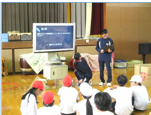
11月4日(火) 11月11日(火) 3年生総合的な学習の時間

3年生は「好きなこと・得意なことを生かして社会貢献をしよう」というテーマで学習しています。その一環として、大和小学校の生徒とごみの分別やSDGsについて学習したり、運動の楽しさを伝えたり、バレーボールに興味を持ってもらう活動を行いました。