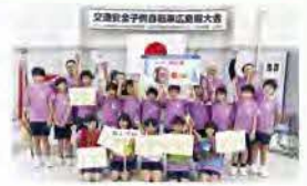
昨年優勝の原小学校チーム