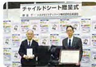
専務理事と今井支社長(右)

3月4日(火)、トヨタモビリティパーツ株式会社広島支社(安芸郡坂町)から、チャイルドシート等(乳幼児用6台、学童用6台)の寄贈がありました。同社からの寄贈は平成22年から行われており、今回で16回目となります。寄贈されたチャイルドシート等は、県内の交通安全協会会員様に無料で貸し出ししております。