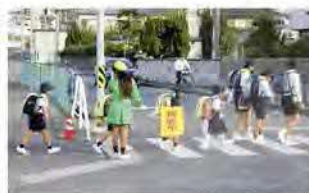
毎月1日、15日の横断指導

具体的活動としては、各季の交通安全運動期間中における関係団体と協働しての交通安全広報活動(大型店舗等での街頭キャンペーン等)や毎月1日と15日の