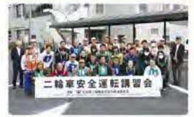
昨年講習会の様子