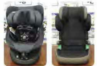
チャイルドシート等(ISOFIX固定方式)