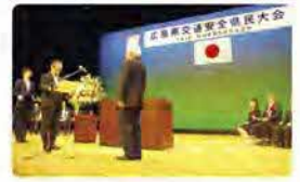
昨年表彰式の様子