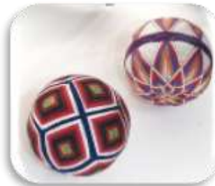
資料館に展示している「手まり」

手づくりの「手まり」はそれぞれに違って、愛情いっぱいの自慢の「まり」だったに違いありません。