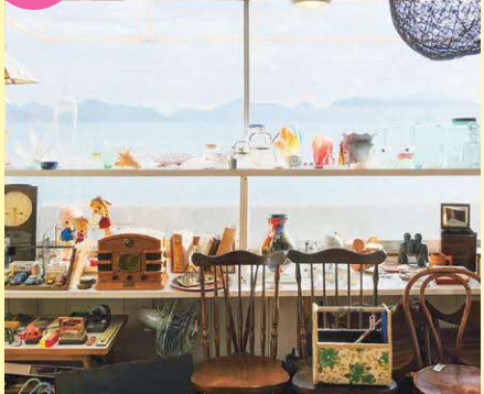
目の前には瀬戸内海が広がる