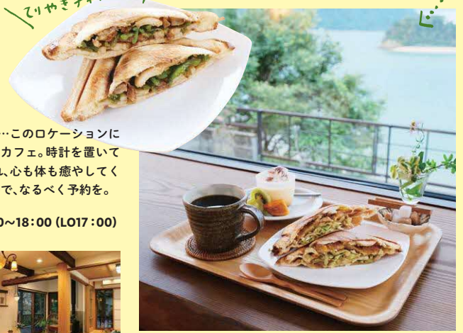
ホットサンドセット(懐かしのコロケサンド)1180円。 ドリンクとプリン付き