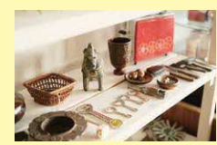
商品は300円~のお手頃価格。 船のランプやボトルシップなど マリナー系のグッズも充実

空き家の片付け業務を行う系列店から仕入れた、中古品や未使用品を取り扱うアンティークショップ。時を重ねた家具やレトロな雑貨に再び息吹を吹き込み、次世代へとつなぐ。ほとんどが一点物なので、一期一会の出会いを楽しんで。