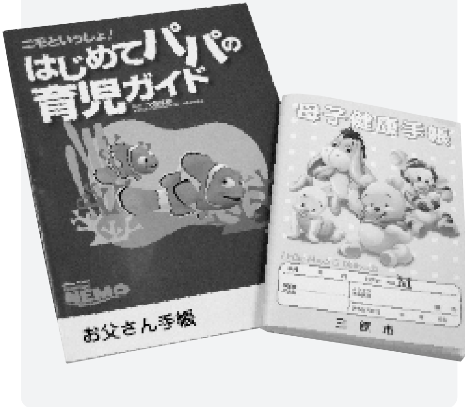
父子手帳と母子手帳の一例

今後関係者による運営委員会を設置し、機能強化を図るとともに、行政機構の見直しも含め、財政的支援・人的支援・拠点整備など検討、実施していく。