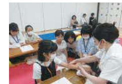
▲エステティシャン