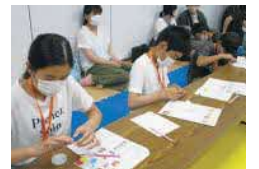
▲キャンドルアーティスト