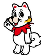
広島広域都市圏マスコットキャラクター ひろしま都市犬はっしー