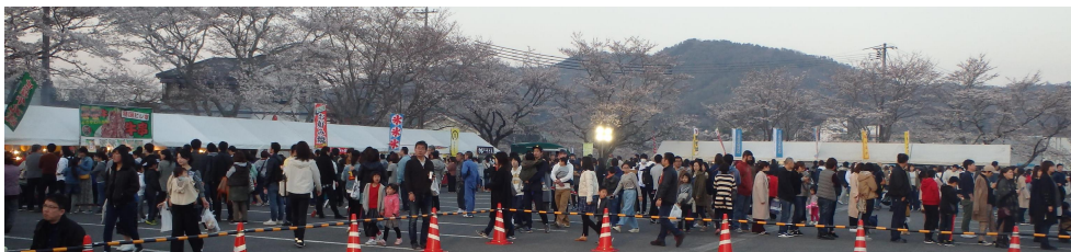
▲平成31年（第5回）開催時の様子