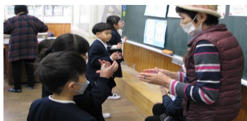
色々な変化を楽しむ「あやとり」遊び