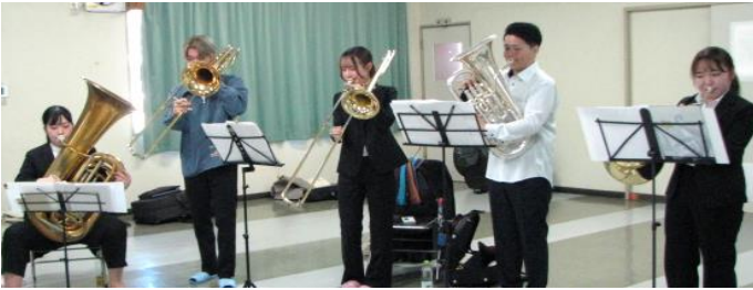
音楽祭直前の猛練習スナップです。

毎月1~2回の練習では近所の迷惑にならないように音量なども控えて練習されているとのこと。こうした若い人たちの活動に、地域の皆さんも温かい目で接してあげて下されば幸いです。