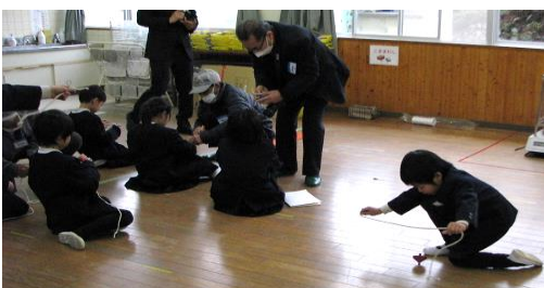
僕も回せたぞ!と、「コマ回し」