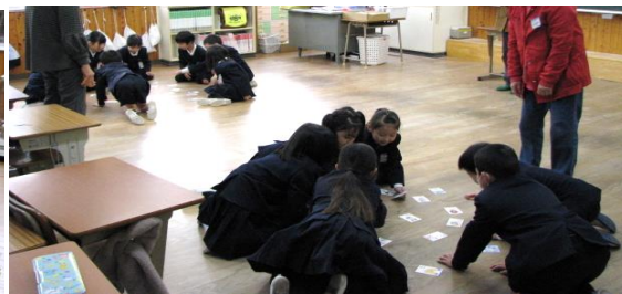
負けないぞ!と、「かるた取り」

2月22日(木) 中之町老人会連合会と更生保護女性会の皆さんが、中之町小1年生51名に「昔遊び」の指導に出向されました。昔遊び(伝承遊び)は友達同士で協力したり競争することを通してコミュニケーション能力を高め、日本古来の伝統的な文化を学ぶことの出来る取り組みとして中之町小では長年行われて来たものですが、コロナ禍で中断し、4年ぶりに再開されたものです。