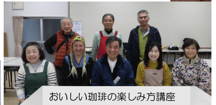
おいしい珈琲の楽しみ方講座

毎回おいしい珈琲を飲み、年10回の講座で豆知識や歴史など、なかなか得ることができない内容を学びました。