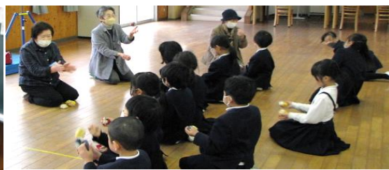
お祖母ちゃんのスゴ技「おてだま」指導