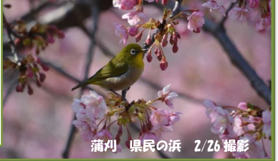
蒲刈 県民の浜 2/26 撮影