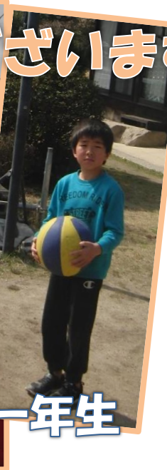
お宝ちゃん ピッカピッカの一年生

元気で、意欲的 チャレンジ精神旺盛 コミュニケーション をとるのがとっ ても上手です。