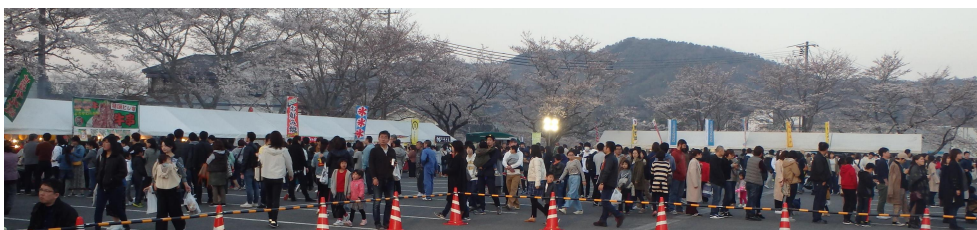
▲平成31年（第5回）開催時の様子