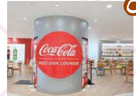
広々としたラウンジ。 壁には歴代の商品がずらり