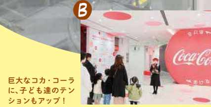
B 巨大なココ・コーラ に、子ども達のテン ションもアップ！

大人も子どもも楽しめる 三原市&世羅町の見学スポットを案内。 普段は目にする事のない工場や酒蔵、 ダムを訪れば、新たな発見があるはず