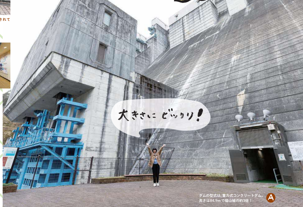
A ダムの型式は、重力式コンクリートダム。高さは84.9mで福山城の約3倍!