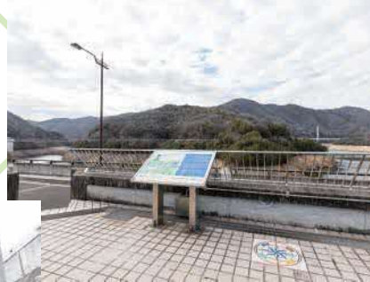
B 案内図が設置されている展望台