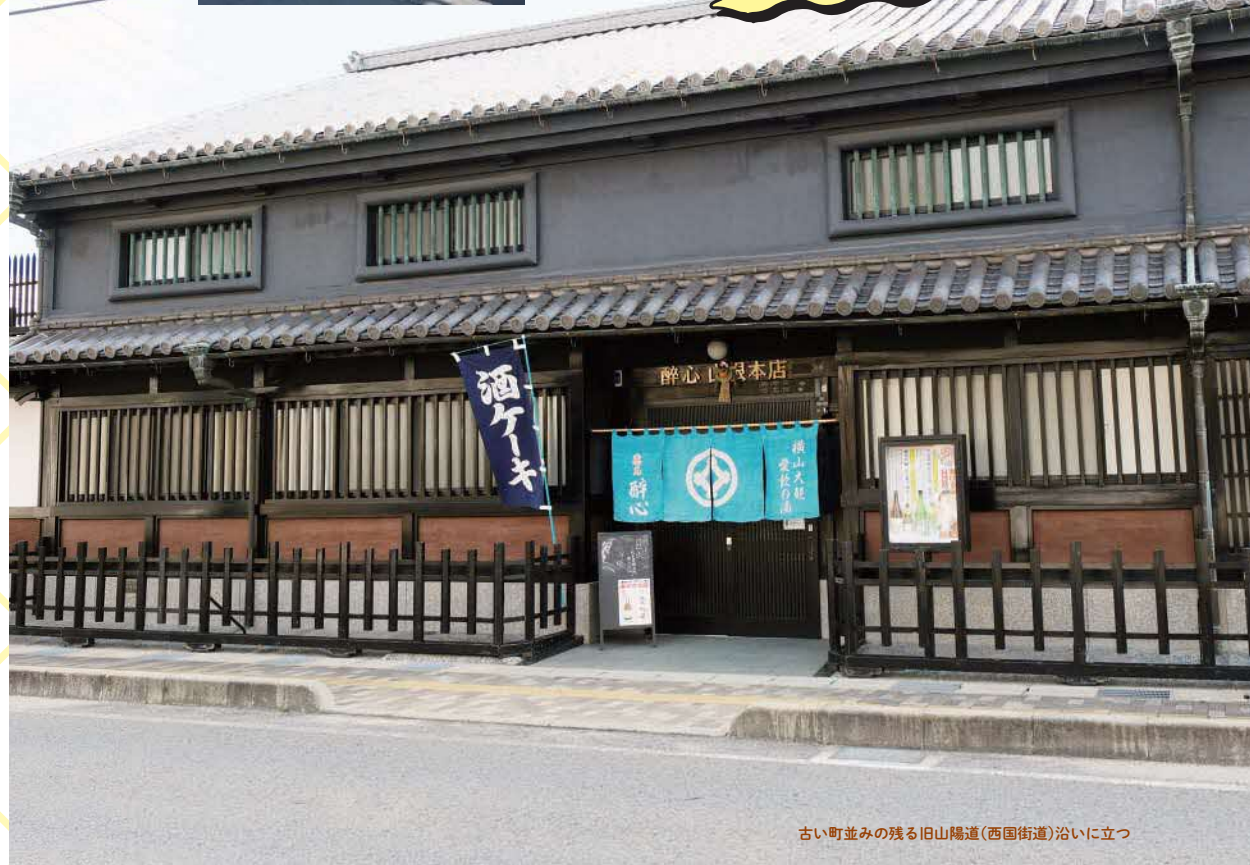
古い町並みの残る旧山陽道(西国街道)沿いに立つ