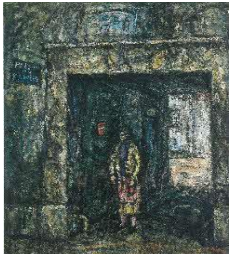
⑩「門」 秦森康屯 162.0×130.5(cm)