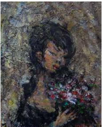
⑮「花の少女」 秦森康屯 41.0×31.8(cm)