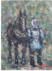
④「馬と農婦」 秦森康屯 33.2×24.2(cm)