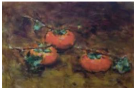
⑫「柿」 秦森康屯 24.5×33.4(cm)