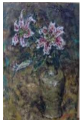
⑯「ゆり(グレープ)」 秦森康屯 45.7×38.0(cm)