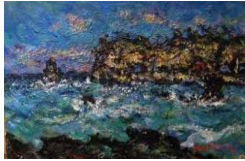
⑧「男鹿風景」 秦森康屯 24.2×33.3(cm)