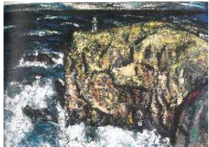
⑦「足摺岬」 秦森康屯 95.2×120.0(cm)