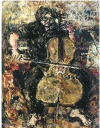
①「チェロを弾くTOKIO」 秦森康屯 162.0×112.5(cm)