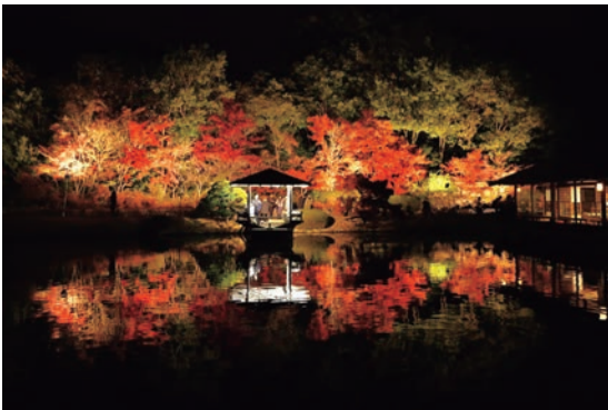
←受賞作品 三景園/ 酒井勝司

(広島県)三原市、尾道市、福山市、府中市、世羅町、神石高原町 (岡山県)笠岡市、井原市