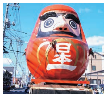
▲現在の4代目大だるま