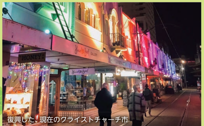
復興した、現在のクライストチャーチ市