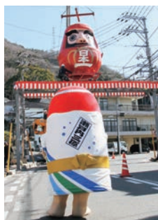
半世紀ぶりに新調