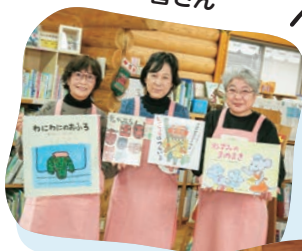
ボランティアスタッフの皆さん