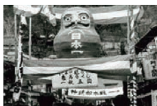
和紙と竹でできてます