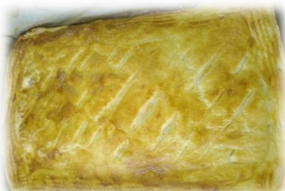
たっぷりチーズとベーコン入り