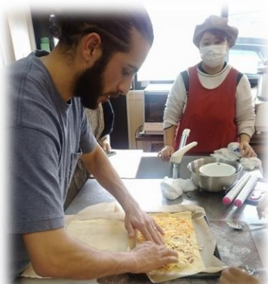
パイ生地から作りました。