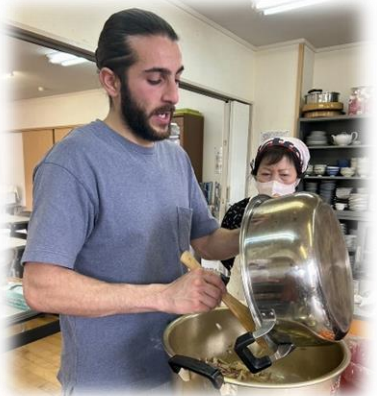
具材がゴロゴロ・・・そして野菜のうま味が最高

しかも「見た目より簡単で美味しかった」と感想もいただきました。試食も和気あいあいと進み、また次回の開催を楽しみにとお腹も心も大満足で名残惜しそうにそれぞれの帰路につかれました。