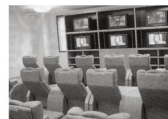
リラックスルーム

☎0847・22・4126●世羅郡世羅町甲山134 営業10:00～22:00 休年中無休 料1,000円(館内着・タオル付)●湯質/トルマリン湯・漢方薬湯他●効能/疲労回復・冷え性・神経痛・筋肉痛・肩こり他●主な浴槽/トルマリン湯・純正漢方薬湯・遠赤外線サウナ・薬草チームサウナ・ハーブ湯・露天風呂他●付帯施設/レストラン・売店・岩盤浴●アクセス/山陽自動車道三原久井ICからクルマで約20分■編集室より/リラックスルームもあり、館内着で一日ゆっくりつろげる。話題の岩盤浴も人気だ。今高野山散策の拠点に。