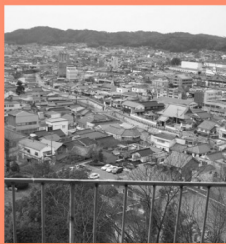
今高野通りを望む マップP13 今高野山敷地内の普門閣は今高野通り一帯が眺められる展望スポット。