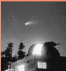
宇根山天文台 マップP15-B みはらっせの最高峰、久井の宇根山に建つ天文台。スターウォッチングを楽しもう。