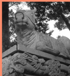
牛市の名残り マップP15-B 日本三大市場として知られる「牛市」。久井は西日本各地から商人や牛たちが集まる町だった。