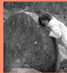
久井の岩海 マップP15-B 日本最大級の岩海で、国天然記念物。岩から聞こえる流水の音が神秘的。