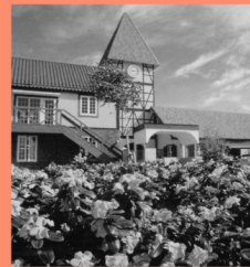
果実の森公園 マップP16-B 四季折々の果実が楽しめる大の大型観光農園。果物をふんだんに使った加工品も人気。