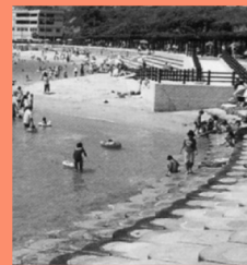
すなみ海浜公園 マップP15-C 海水浴だけではなくドライブの休憩やオシャレなレストランでの食事を楽しむ。