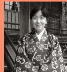
御調八幡宮 マップP15-B 西の吉野といわれ桜の名所でもある。やが川自然公園の中心にある歴史ある神社。