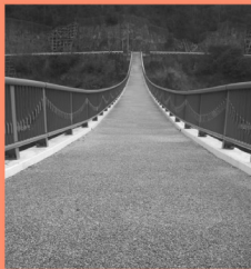
夢吊橋 マップP15-A 甲山・八田原ダム湖のシンボル、全長172.6mの大吊橋。紅葉シーズンの散策もオススメ。