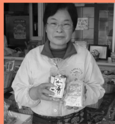
世羅のいわし漬 マップP16-A 特産品センター「かめりあ」で作るいわし漬は、江戸時代から伝わる冬場の保存食。