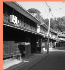
幸崎町の町並み マップP15-C 三原市幸崎能地は古くからの漁師町。フンだんじりで有名な春祭りは県の無形文化財。