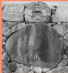
康徳寺の世羅ダルマ マップP15-A 雪舟庭園で有名な世羅の康徳寺。表の石垣にでっかいダルマが埋まっている。