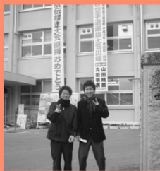
日本一の世羅高校 マップP14 駅伝で有名な学校。誰とでも気軽に挨拶を交わせる明るい生徒が多い。