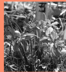
エヒメアヤメ マップP9 三原市沼田西町に自生する国の天然記念物。4月には一般公開もされる。