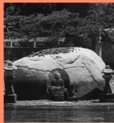
磨崖和霊石地藏 マップP15-C 須波港対岸の佐木島に、満潮時には海中に水没するお地藏さんがいる。