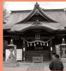
糸碕神社 マップP15-C 天平元年(729)に建てられた糸碕神社。境内には樹齢500年といわれるクスノキがある。