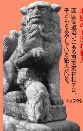
本郷の子連れ狛犬 西国街道沿いにある恵美須神社では、子どもをあやしている狛犬がいる。 マップP9