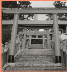
久井稲生神社 マップP15-B 伏見稲荷神社の分霊としては日本最古の神社。赤い鳥居が並ぶ階段が印象的。