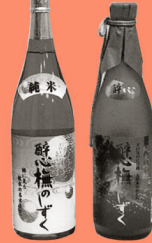
三原の地酒 マップP5 横山大観がこよなく愛飲した酒「酔心」。プナ林の湧水でつくられた絶品のお酒がある。