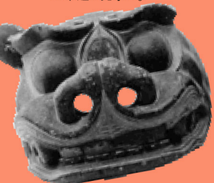
木造獅子頭 マップP13 黒塗りで金や朱色で彩色されている獅子頭。大田庄歴史館で見ることができる。