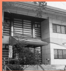
大田庄歴史館 マップP13 平安時代からの長い歴史がある「大田庄」の盛衰が収められている歴史館。