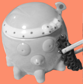
あっぱれタコ 三原お土産の推奨品「多幸のあっぱれ煮」。陶器製の入れ物がカワイイ。