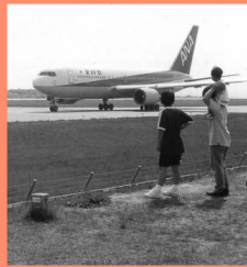
広島空港 マップP16-B 周辺には中央森林公園、三景園など空港利用のほか、レンタカーも楽しめる。