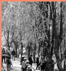
甲山ふれあいの里 マップP15-A 吉野桜をはじめ、いろいろな桜が楽しめる。特にしだれ桜の並木道は見事だ。