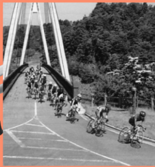
中央森林公園 マップP16-B 飛行機が間近で見れる広場や、空港をぐるっと回れるサイクリングロードもオススメ。