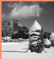
世羅・冬の風物詩 マップP16-A 今では珍しくなった藁の保存法「わら棒塔」。後ろは津田明神山。