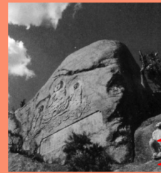
白滝山 マップP16-C 三原と竹原の市境にある白滝山。山頂の岩には釈尊三尊像が彫られている。