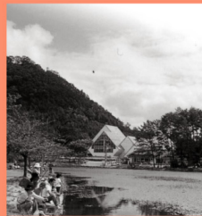
せらに青少年旅行村 マップP16-A スポーツはもちろんキャンプや釣りなど、1日中楽しめる大型レクリエーション施設。