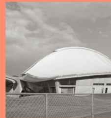
白竜ドーム マップP16-B 白竜湖のランドマークとなるスポーツ専用のアリーナ。白い竜をイメージしたユニークな設計。