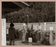
たかやまじょうせき 高山城跡